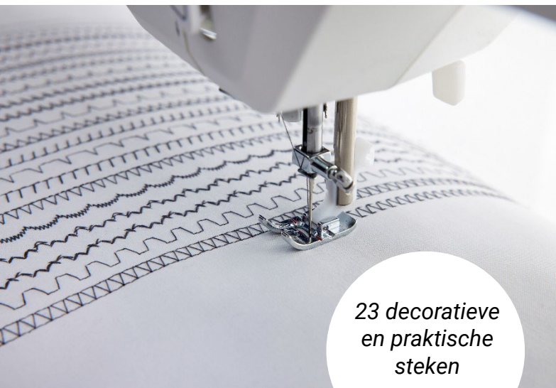
23 decoratieve en praktische steken